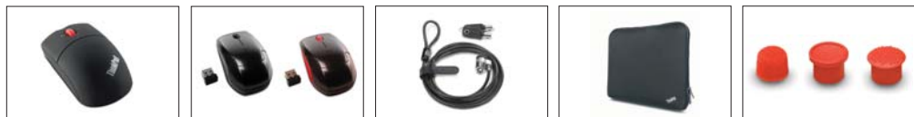
ThinkPad Bluetooth レーザーマウス (41U5008) Lenovo ワイヤレスレーザーマウス - ブラック (45K1696) - レッド (51J0198) Kensington マイクロセーバーセキュリティーケーブル (73P2582) 15.6" Wide用 インナーケース (51J0477) ThinkPlus トラックポイントキャップコレクション (73P2698)