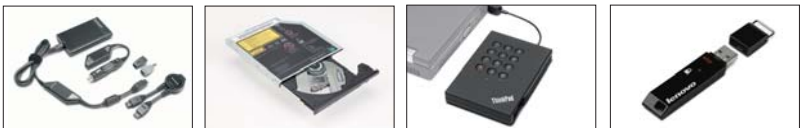
Lenovo 90W ウルトラスリム AC/DC コンポ.アダプター (41R4500) ThinkPad T400s ウルトラベイ スリムシリアルATAブルーレイバーナー-2 (43N3230) ThinkPad USB ポータブルセキュアハードディスク - 160GB (43R2018) - 320GB (43R2019) Lenovo USB ウルトラセキュアメモリーキー 2GB - (45J5916) 4GB - (45J5917) 8GB - (45J5918)