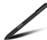
Penna digitale per ThinkPad (41U3143)