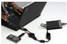
Adattatore Combo AC/DC ultrasottile da 90 W Lenovo (41R44xx)