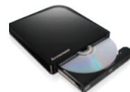
Masterizzatore DVD USB portatile Lenovo (43N3264)