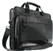
Borsa Business Topload per ThinkPad (43R2476) Zaino per ThinkPad (43R2482)