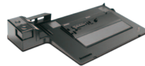
Mini Docking Station Plus Serie 3 per ThinkPad (0A902xx)